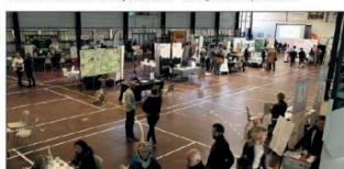
L'événement a rassemblé une vingtaine d'exposants et draine un public nombreux.

L'AREVE aura également connu deux temps forts marquants dans sa relation avec les professionnels avec l'organisation d'un salon professionnel à Draguignan, sur les seuls moyens de l'AREVE et avec l'unique participation de professionnels partenaires.