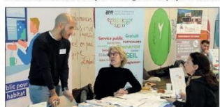
Il s'agit d'éviter la plupart des pièges tendus par certains commerçants peu scrupuleux.

chauffage, correctement dimensionnés. Il existe des aides pour tous. L'Areve aide le maître d'ouvrage à les mobiliser, avant les travaux ». Renseignements : http://lareve83.fr S. F.