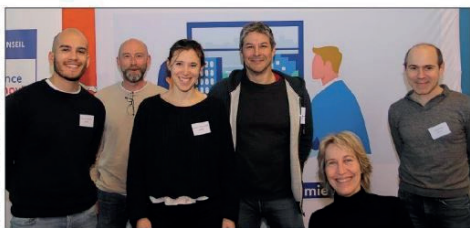
Les conseillers de l'Areve accueillent le public à Draguignan (quartier Chabran). Les conseils de l'organisme sont neutres et gratuits.

Commencer par un diagnostic Fabrice Vitreau, directeur de l'Areve, vante les atouts de la structure et insiste sur l'impor-